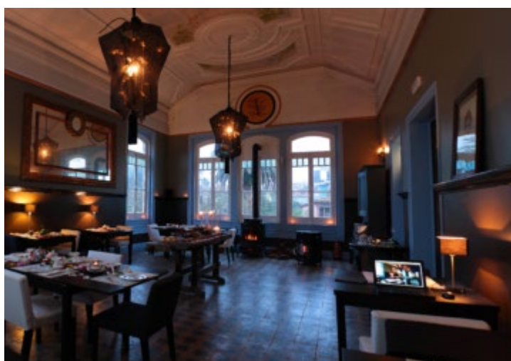
Em Sintra há tapas e vinhos para saborear ao som do jazz todos os domingos