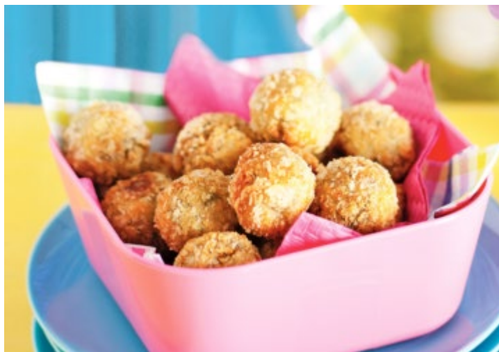
As deliciosas bolinhas de atum que se fazem com 6 ingredientes