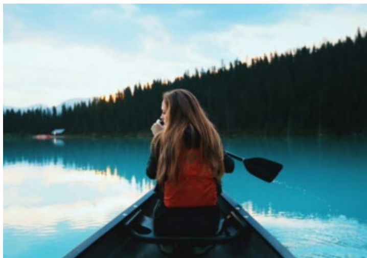
Blogger de viagens desafia outros influenciadores a pagar as suas próprias férias