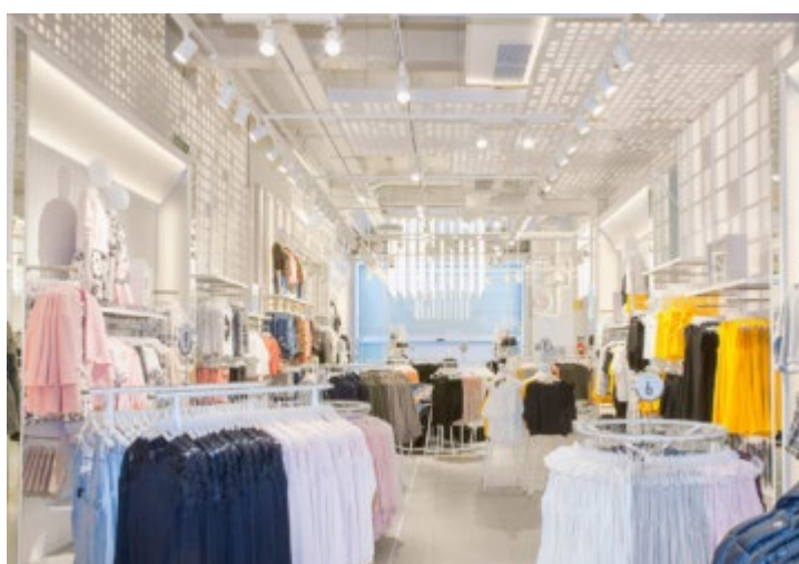
As leggings que moldam todos os corpos também chegaram à Lefties