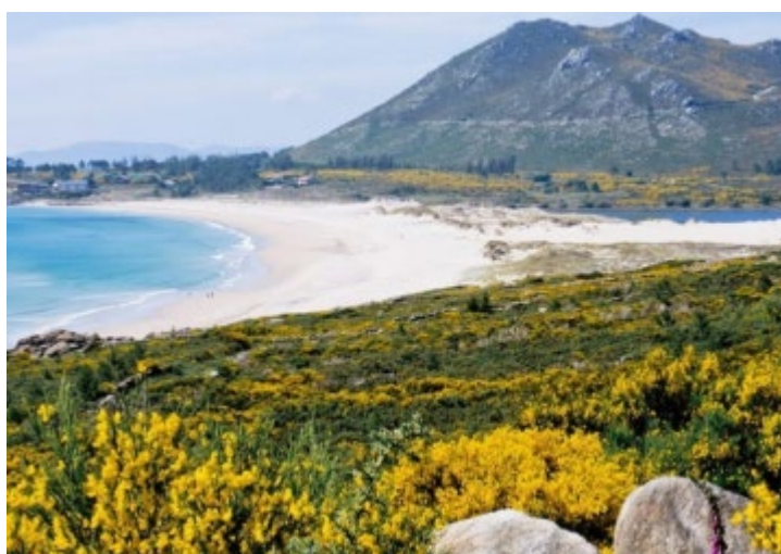
Viajantes de Portugal têm de se registar e deixar contactos para visitar a Galiza