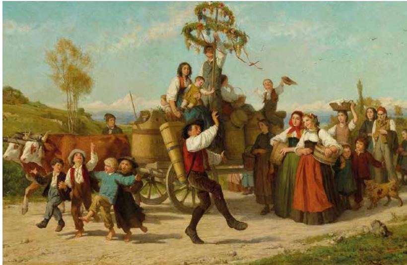
"The wine festival" Albert Anker

“O que é bonito neste mundo, e anima, é ver que na vindima de cada sonho fica a cepa a sonhar outra aventura. E que a doçura que não se prova se transfigura noutra doçura muito mais pura e muito mais nova!”