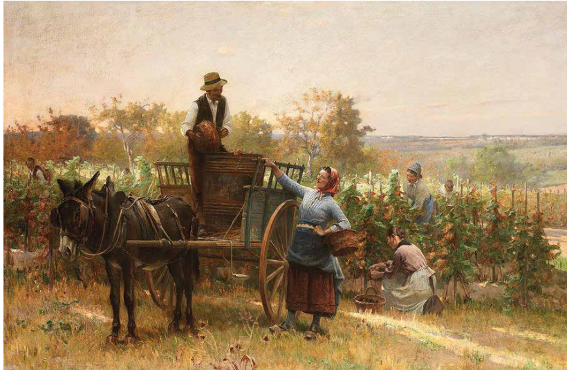
"The grape harvest painting" Adrien Moreau

Junte-se a nós e venha conhecer todo o processo, desde a colheita da uva ainda nas vinhas, até à sua transformação na adega!